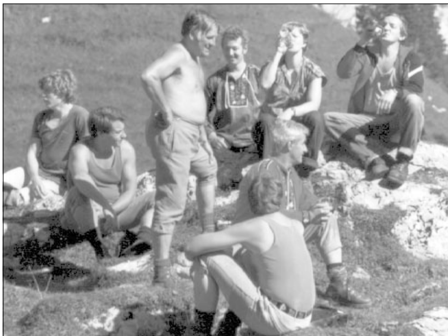
"Gipfelrast" an einer Sommertour

Die zur Tradition gewordenen Sommertouren führte die Ski-Clubfamilie in den folgenden Jahren stets in neue Wandergebiete. Es begann mit dem Aufstieg zur Saxerlücke im Rheintal und endete vorläufig mit dem Aufstieg zum hochgelegenen Dorf Juf.