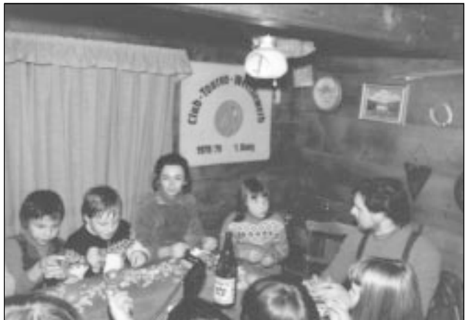
Beim Nachtessen in der warmen Stube.