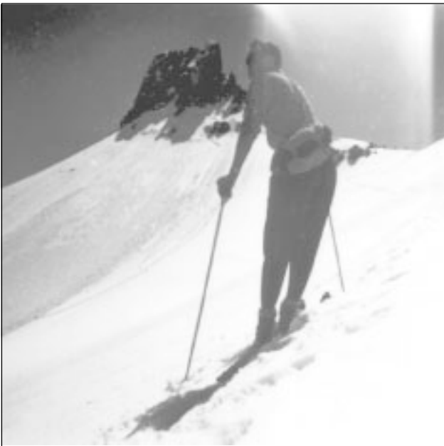
Skitour im Spitzmeilengebiet.

Die Gefahr wurde aber rechtzeitig erkannt, und deshalb wurde das Vereinstourenfahren gefördert. Der SC Arve beteiligte sich im Winter 1955/56 erstmals am schweizerischen Club-Touren-Wettbewerb. Damit begann im Verein eine neue Aera. Dieser gesunde Sport hielt den Krebsgang allmählich auf.