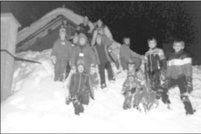
Gruppenbild auf dem Dach der Hütte.