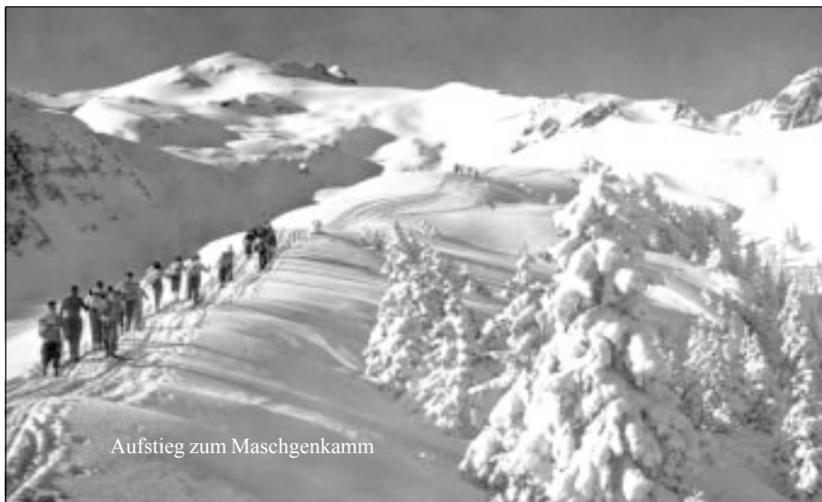
Aufstieg zum Maschgenkamm