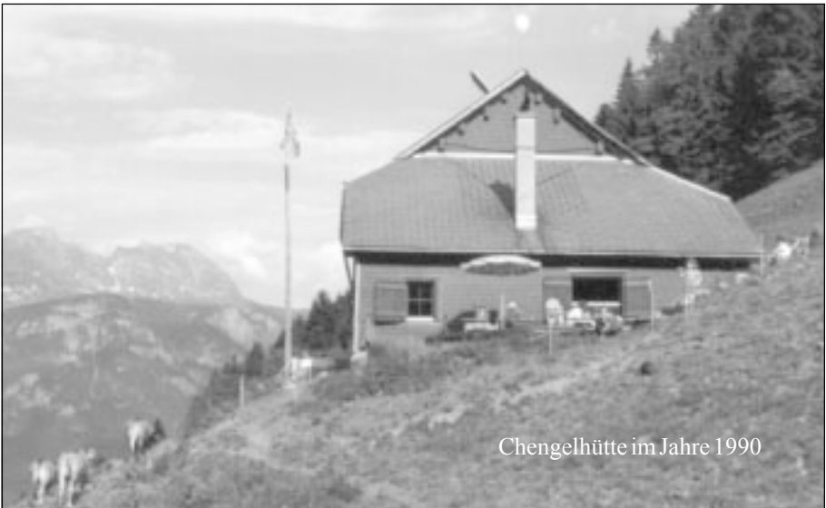
Chengelhütte im Jahre 1990